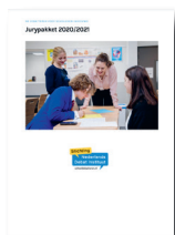
Parlementair debat (NK Scholieren havo/vwo)

Onze jurywijzer en aantekeningbladen gebruiken? Die vind je hier: