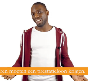
Leraren moeten een prestateloon krijgen.

→ Herkenwoorden: 'doet meer kwaad dan goed', 'is beter dan', 'zouden altijd moeten', 'slecht', 'goed', of 'mogen'.