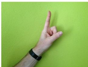
Nog één minuut...

Als leerling-jurylid heb je daarnaast ook na het debat nog een belangrijke taak: tijdens het overleg dien je tijd goed in de gaten te houden en aan te geven wanneer de tijd voorbij is. Hetzelfde geldt voor het bewaken van de tijd tijdens het feedback geven aan de debaters: mede dankzij de leerling-juryleden verloopt het toernooi daarom op schema.