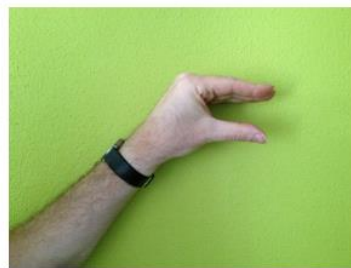
Nog een halve minuut...