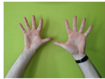
Nog 10 seconden...